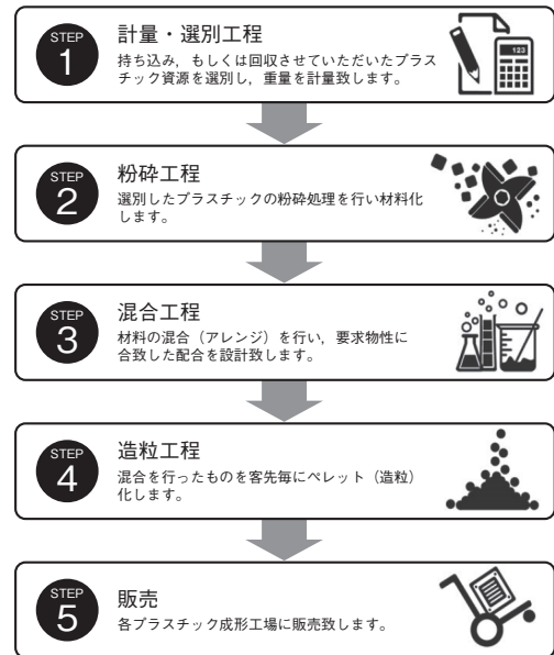
プラスチックペレット加工の流れ

後で知ることになるが、代表者は大阪商業大学のご出身で計数に強く、それこそ裸一貫での創業であったから、生半可のことで妥協される方ではない。自宅以外ではほとんど工場ユニフォームを着用する、それこそ仕事一筋の方である。住工混在解消のための豊野工場団地の建設に際しては協同組合化に協力し、長く理事（電気委員長）として尽力された。