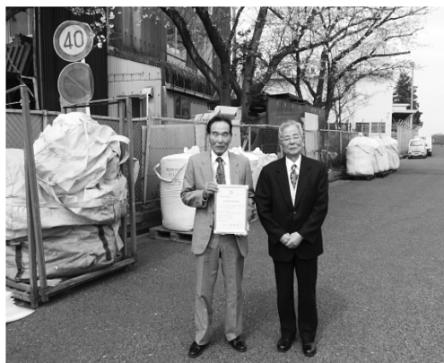
経営革新計画承認証を得て

経営革新3年計画目標伸び率は、付加価値率19%、一人当たり付加価値率17%、経常利益率81%である。